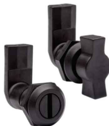
Furação para montagem