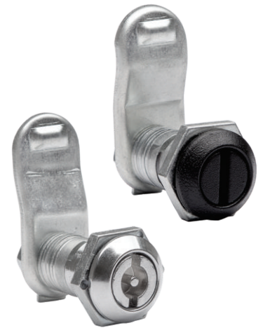
Perforación para Montaje